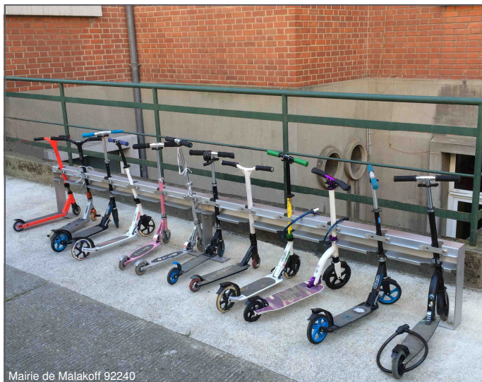
Mairie de Malakoff 92240